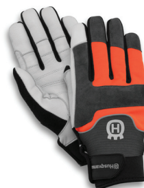
ПЕРЧАТКИ TECHNICAL 596 30 67-12