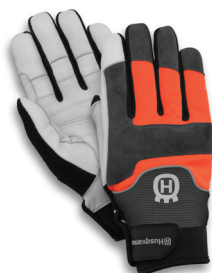
ПЕРЧАТКИ TECHNICAL 596 30 67-10