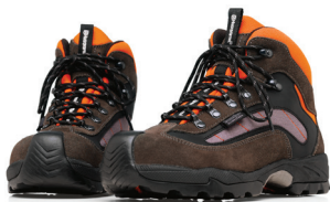
БОТИНКИ TECHNICAL С ЗАЩИТОЙ ОТ ПОРЕЗОВ БЕНЗОПИЛОЙ 575 35 47-45