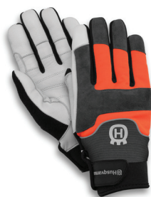
ПЕРЧАТКИ TECHNICAL 579 38 04-09