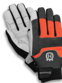
ПЕРЧАТКИ TECHNICAL 579 38 04-10