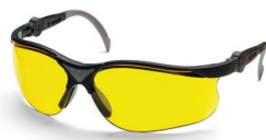
ОЧКИ ЗАЩИТНЫЕ YELLOW X 544 96 37-02