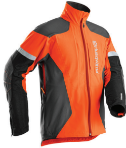
КУРТКА ДЛЯ РАБОТЫ В ЛЕСУ, TECHNICAL, P. 54/56 (L) 582 33 21-54