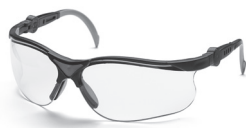
ОЧКИ ЗАЩИТНЫЕ CLEAR X 544 96 37-01