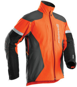
КУРТКА ДЛЯ РАБОТЫ В ЛЕСУ, TECHNICAL, P. 62/64 (XXL) 582 33 21-62