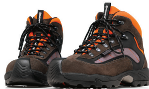
БОТИНКИ ЗАЩИТНЫЕ TECHNICAL 575 35 47-40