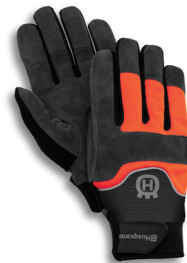
ПЕРЧАТКИ TECHNICAL LIGHT 579 38 06-09