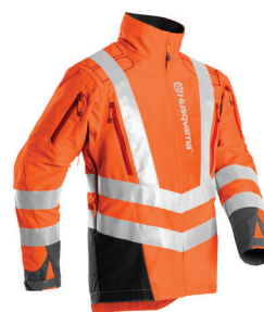
КУРТКА TECHNICAL С ВЫСОКОЙ ЗАМЕТНОСТЬЮ ДЛЯ РАБОТЫ С ТРАВКОСИЛКОЙ 597 24 59-62