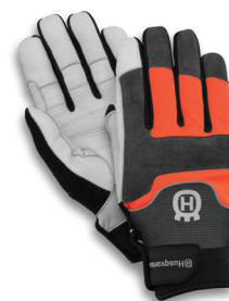
ПЕРЧАТКИ TECHNICAL 579 38 04-12