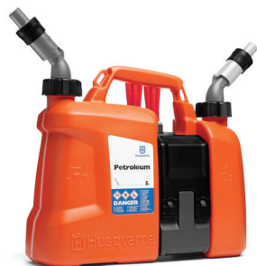
КАНИСТРА ТОПЛИВНАЯ КОМБИНИРОВАННАЯ 580 75 42-01