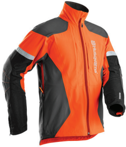
КУРТКА ДЛЯ РАБОТЫ В ЛЕСУ, TECHNICAL, P. 50/52 (M) 582 33 21-50