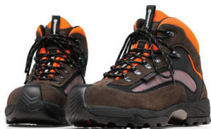
БОТИНКИ TECHNICAL С ЗАЩИТОЙ ОТ ПОРЕЗОВ БЕНЗОПИЛОЙ 596 30 64-44