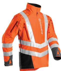
КУРТКА TECHNICAL С ВЫСОКОЙ ЗАМЕТНОСТЬЮ ДЛЯ РАБОТЫ С ТРАВКОСИЛКОЙ 597 24 59-54