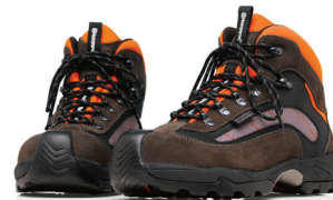
БОТИНКИ TECHNICAL С ЗАЩИТОЙ ОТ ПОРЕЗОВ БЕНЗОПИЛОЙ 575 35 47-41