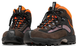
БОТИНКИ TECHNICAL С ЗАЩИТОЙ ОТ ПОРЕЗОВ БЕНЗОПИЛОЙ 575 35 47-43