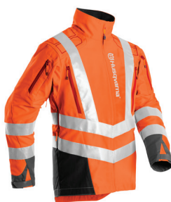
КУРТКА TECHNICAL С ВЫСОКОЙ ЗАМЕТНОСТЬЮ ДЛЯ РАБОТЫ С ТРАВКОСИЛКОЙ 597 24 59-50