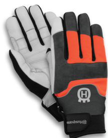
ПЕРЧАТКИ TECHNICAL 596 30 67-09