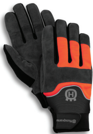
ПЕРЧАТКИ TECHNICAL LIGHT 596 30 92-10