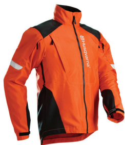
КУРТКА ДЛЯ РАБОТЫ С ТРАВКОСИЛКОЙ TECHNICAL 580 68 82-50