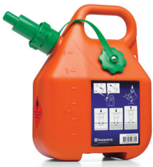
КАНИСТРА ТОПЛИВНАЯ 505 69 80-01