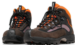
БОТИНКИ TECHNICAL С ЗАЩИТОЙ ОТ ПОРЕЗОВ БЕНЗОПИЛОЙ 575 35 47-44