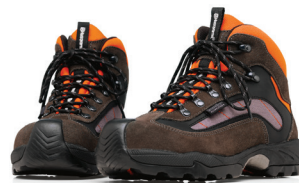
БОТИНКИ TECHNICAL С ЗАЩИТОЙ ОТ ПОРЕЗОВ БЕНЗОПИЛОЙ 596 30 64-42