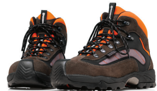
БОТИНКИ TECHNICAL С ЗАЩИТОЙ ОТ ПОРЕЗОВ БЕНЗОПИЛОЙ 575 35 47-42