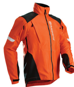
КУРТКА TECHNICAL ДЛЯ РАБОТЫ С ТРАВКОСИЛКОЙ 580 68 82-46