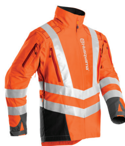
КУРТКА TECHNICAL С ВЫСОКОЙ ЗАМЕТНОСТЬЮ ДЛЯ РАБОТЫ С ТРАВКОСИЛКОЙ 597 24 59-58