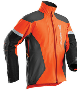
КУРТКА ДЛЯ РАБОТЫ В ЛЕСУ, TECHNICAL, P. 58/60 (XL) 582 33 21-58