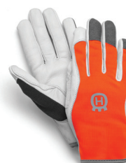
ПЕРЧАТКИ CLASSIC LIGHT 596 31 06-06